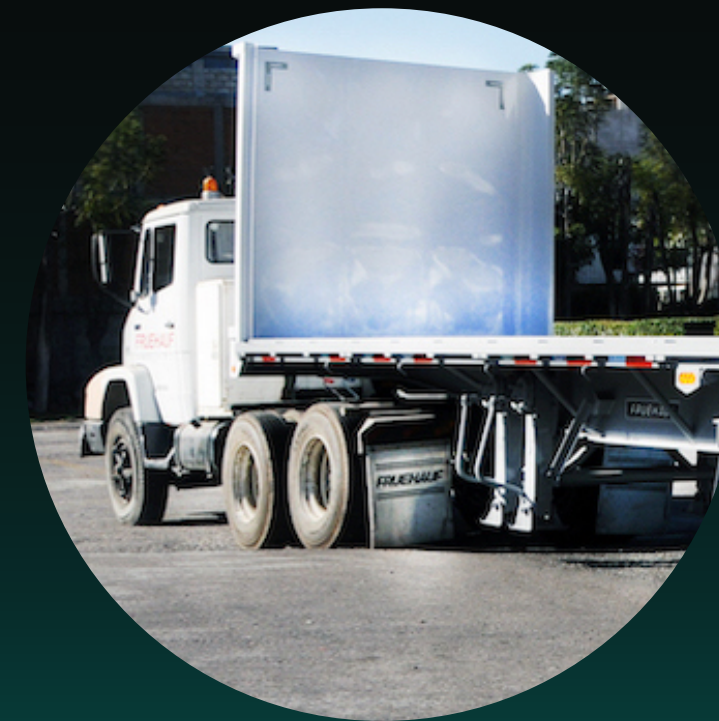
Remolque de cama plana