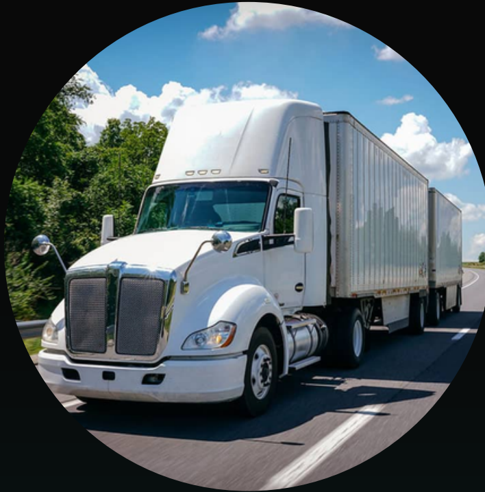
Full doble remolque