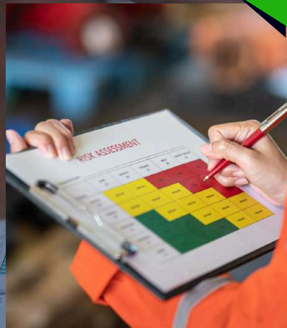
ANÁLISIS DE RIESGOS